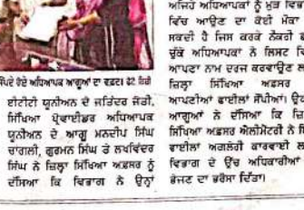
ਵੱਡੇ ਵੱਡੇ ਮੌਕੇ ਸੰਬੰਧਿਤ ਚੁਣੌਤੀਆਂ ਦਾ ਸੰਕੇਤ।

ਵੱਡੇ ਵੱਡੇ ਮੌਕੇ ਸੰਬੰਧਿਤ ਚੁਣੌਤੀਆਂ ਦਾ ਸੰਕੇਤ। ਵੱਡੇ ਵੱਡੇ ਮੌਕੇ ਸੰਬੰਧਿਤ ਚੁਣੌਤੀਆਂ ਦਾ ਸੰਕੇਤ।