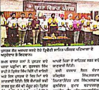
ਗਜ਼ਲ ਸੰਗ੍ਰਹਿ 'ਵਾਟ ਹਯਾਤੀ ਦੀ' ਲੋਕ ਅਰਪਣ।

ਗਜ਼ਲ ਸੰਗ੍ਰਹਿ 'ਵਾਟ ਹਯਾਤੀ ਦੀ' ਲੋਕ ਅਰਪਣ। ਗਜ਼ਲ ਸੰਗ੍ਰਹਿ 'ਵਾਟ ਹਯਾਤੀ ਦੀ' ਲੋਕ ਅਰਪਣ।