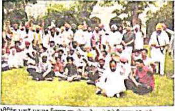
ਮੁੱਖ ਮੰਤਰੀ ਨੇ ਘਿਰਾਓ ਕਰਨ ਦਾ ਐਲਾਨ ਕਰਦੇ ਹੋਏ ਕਿਹਾ ਕਿ ਉਹ ਆਪਣੇ ਘਰ ਵਾਪਸ ਆਣਗੇ।

ਦਿੱਲੀ ਵਿਧਾਨ ਸਭਾ ਵਿੱਚ ਮੁੱਖ ਮੰਤਰੀ ਨੂੰ ਘਿਰਾਓ ਕਰਨ ਦਾ ਐਲਾਨ ਕਰਦੇ ਹੋਏ ਮੁੱਖ ਮੰਤਰੀ ਨੇ ਕਿਹਾ ਕਿ ਉਹ ਆਪਣੇ ਘਰ ਵਾਪਸ ਆਣਗੇ। ਮੁੱਖ ਮੰਤਰੀ ਨੇ ਕਿਹਾ ਕਿ ਉਹ ਆਪਣੇ ਘਰ ਵਾਪਸ ਆਣਗੇ।