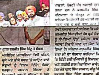
ਸਪੋਰਟਸ ਐਸੋਸੀਏਸ਼ਨ ਦਾ ਫਿਜ਼ੀਕਲ ਫਿਟਨੈਸ ਕੈਂਪ ਸਮਾਪਤ।

ਸਪੋਰਟਸ ਐਸੋਸੀਏਸ਼ਨ ਦਾ ਫਿਜ਼ੀਕਲ ਫਿਟਨੈਸ ਕੈਂਪ ਸਮਾਪਤ। ਸਪੋਰਟਸ ਐਸੋਸੀਏਸ਼ਨ ਦਾ ਫਿਜ਼ੀਕਲ ਫਿਟਨੈਸ ਕੈਂਪ ਸਮਾਪਤ।