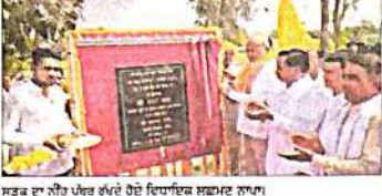
ਵਿਧਾਇਕ ਨੇ ਰੱਤਾਖੇੜਾ ਲਿੰਕ ਸੜਕ ਦਾ ਨੀਂਹ ਪੱਥਰ ਰੱਖਿਆ।

ਵਿਧਾਇਕ ਨੇ ਰੱਤਾਖੇੜਾ ਲਿੰਕ ਸੜਕ ਦਾ ਨੀਂਹ ਪੱਥਰ ਰੱਖਿਆ। ਵਿਧਾਇਕ ਨੇ ਰੱਤਾਖੇੜਾ ਲਿੰਕ ਸੜਕ ਦਾ ਨੀਂਹ ਪੱਥਰ ਰੱਖਿਆ।