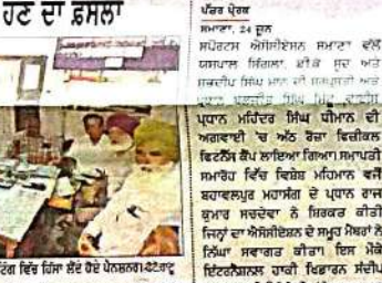
ਪਾਵਰਕੋਮ ਪੈਨਲਬਰਡ ਐਸੋਸੀਏਸ਼ਨ ਵੱਲੋਂ ਜਲਪੁਰ ਝੰਡਾ ਮਾਰਚ ਵਿੱਚ ਸ਼ਾਮਲ ਹੋਣ ਦਾ ਫ਼ੈਸਲਾ।

ਪਾਵਰਕੋਮ ਪੈਨਲਬਰਡ ਐਸੋਸੀਏਸ਼ਨ ਵੱਲੋਂ ਜਲਪੁਰ ਝੰਡਾ ਮਾਰਚ ਵਿੱਚ ਸ਼ਾਮਲ ਹੋਣ ਦਾ ਫ਼ੈਸਲਾ। ਪਾਵਰਕੋਮ ਪੈਨਲਬਰਡ ਐਸੋਸੀਏਸ਼ਨ ਵੱਲੋਂ ਜਲਪੁਰ ਝੰਡਾ ਮਾਰਚ ਵਿੱਚ ਸ਼ਾਮਲ ਹੋਣ ਦਾ ਫ਼ੈਸਲਾ।